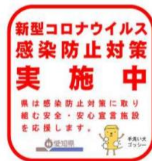
【PRステッカー イメージ】